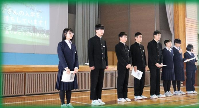
「学校生活を写真で紹介」堂々とした説明が印象的