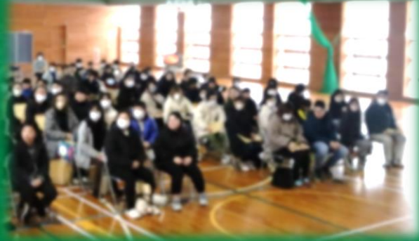
先輩の話と説明内容に聞き入る姿と真剣な眼差し

2月3日（月）に、令和7年度の新入生とその保護者の皆さんをお迎えし、新入生説明会を行いました。学校側からは、中学校生活のきまりや部活動への加入などについて説明いたしました。また、来年度の生徒会執行部の代表から本校の生徒会活動や学校行事について詳しく説明があり、新入生に早く慣れてもらいたいという気持ちが伝えられました。校長からは、中学校へ入学するまでに身につけてもらいたいこととして、「元気でさわやかなあいさつ」、「SNS の正しい使い方」の2つについて話をしました。